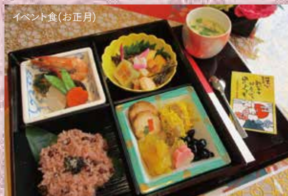
イベント食(お正月)