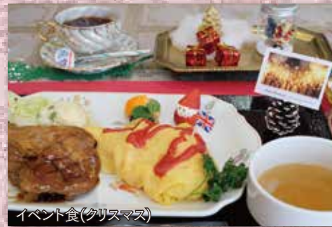
イベント食(クリスマス)