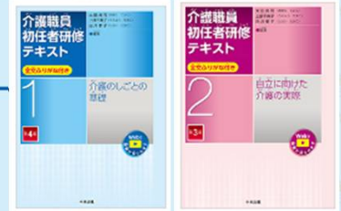
介護職員初任者研修テキスト使用 全2巻 出典 中央法規出版