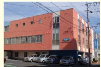
参考：あおぞらの里 小文字デイサービスセンター

通学会場：あおぞらの里 小文字デイサービスセンター隣 パインビル2階（白い建物）